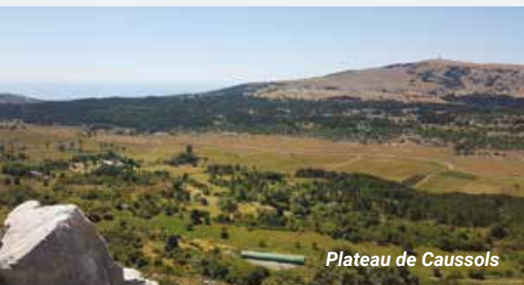
Plateau de Caussois