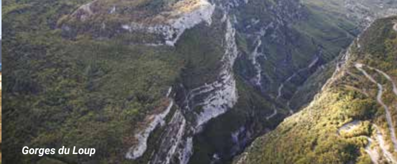
Gorges du Loup