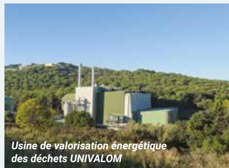
Usine de valorisation énergétique des déchets UNIVALOM

43% des consommations énergétiques liées aux transports